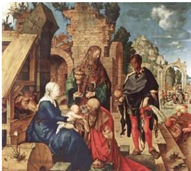
(L'Adoration des mages par Albrecht Dürer (Période 1471-1528 - Huile sur bois)

Dès le XV e siècle « l'Adoration des mages » devient un des thèmes favoris des peintres.